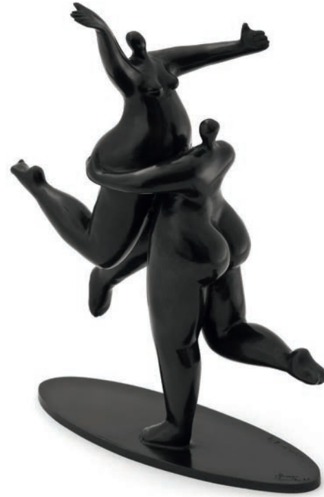
Bronze - Dimensions

Sélectionnée par le célèbre cristallier DAUM pour entrer dans la collection «Love», on connaît notamment ses sculptures en cristal ultraviolet et ambre Maternity Bliss (2009) et Désir (2010). Après une belle exposition organisée par le Bureau des Grands Evénements de Tours dans le péristyle de l'hôtel de ville de Tours en février 2010, on lui a confié la réalisation d'une sculpture de 5 mètres, Ivre de joie , installée à Joué lès Tours.