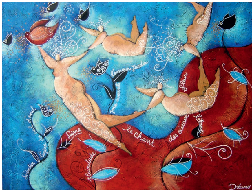
Suivre les oiseaux-fleurs - Dimensions